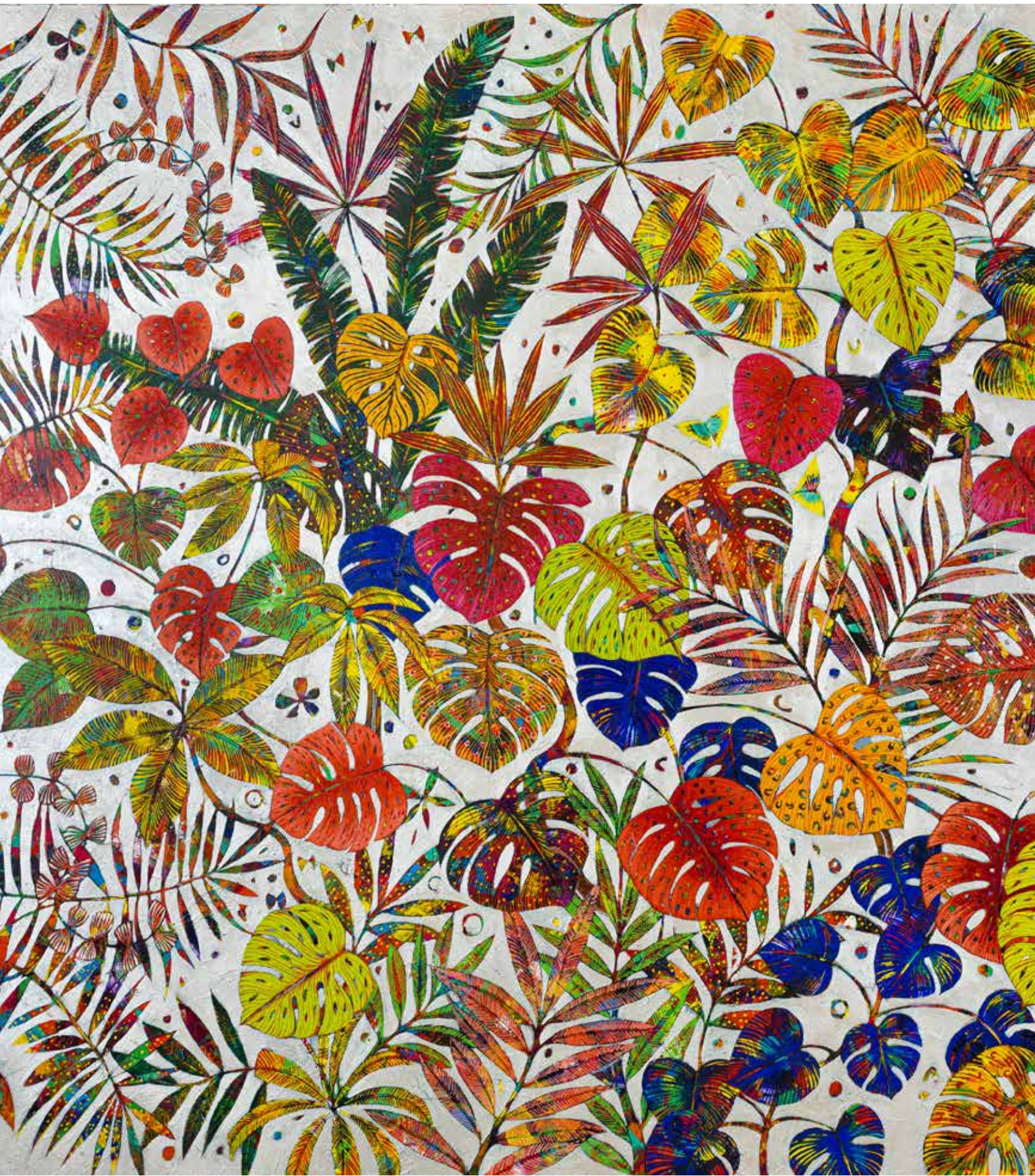
Amazonie - 162x130cm - 2020