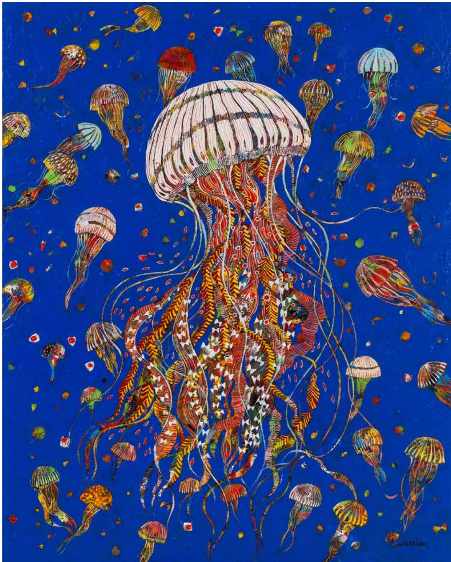
Gelly fish - 92x73cm