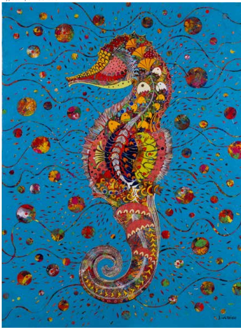
Hypocampe - 130x97cm