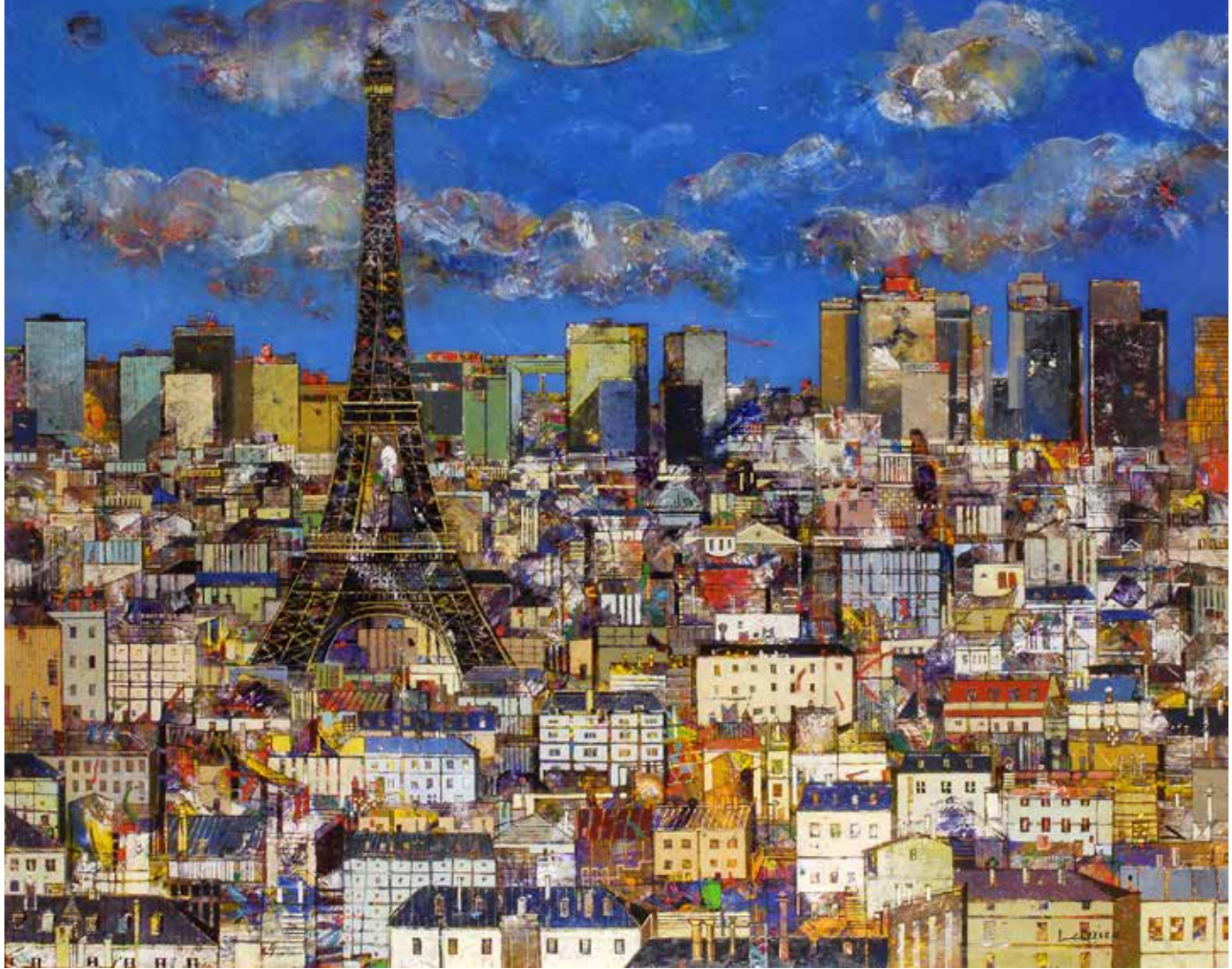
Paris Tour Eiffel - 162x130cm - 2008

Ses Lumières de Vies exposées à la Galerie Barlier sont le prolongement logique de ses préoccupations premières, aujourd'hui devenues les sujets centraux des débats qui animent nos sociétés.